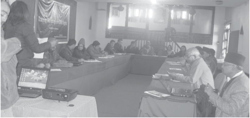
बालअधिकार सम्बन्धी तालीमका सहभागीहरू