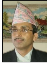
✍️ भानुभक्त आचार्य