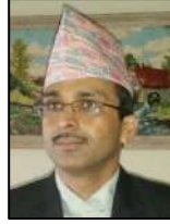
✍️ भानुभक्त आचार्य